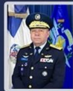
GENERAL DE BRIGADA PILOTO, FLOREAL T. SUÁREZ MARTÍNEZ (FARD) MIEMBRO